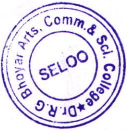
PRINCIPAL Dr. R. G. Bhojar Arts, Comm. & Science College, SELOO

You will perform all the duties assigned by the Principal and in addition to teaching work you will contribute and participate in cultural activities, in game & sports activities and administration. You will not engage yourself in any other activity out- side the college campus without prior approval of the Principal.